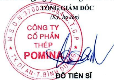
ĐỖ TIẾN SĨ